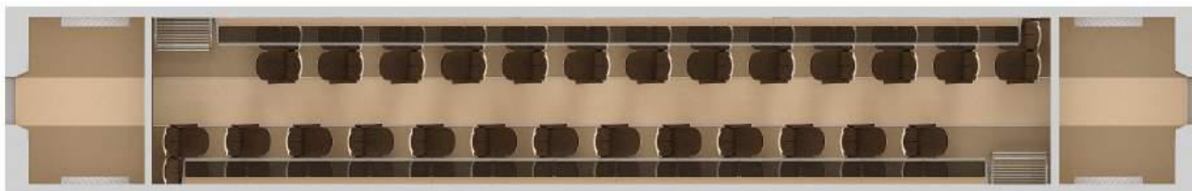
Рис.2. План прицепного и моторного вагонов