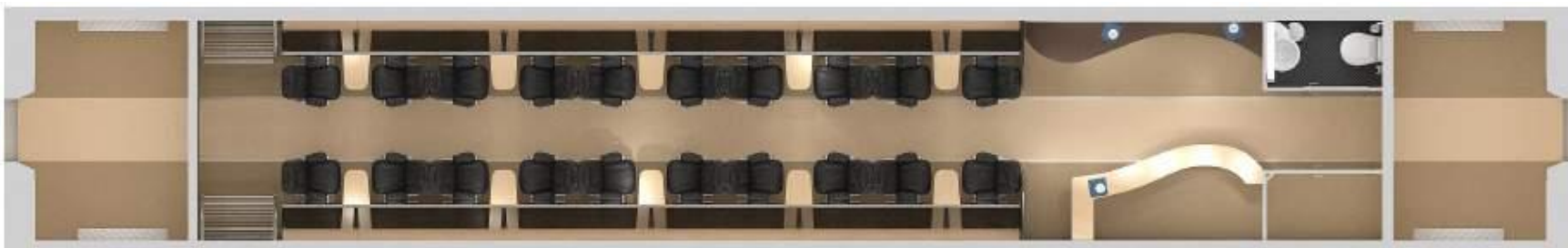
Рис.1. План прицепного вагона повышенной комфортности с баром